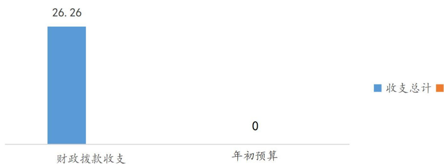
财政拨款收入支出与年初预算对比情况 (图3)

本单位 2020 年度一般公共预算财政拨款收入 26.26 万元，完成年初预算的 100%，比年初预算增加 26.26 万元，主要是职工取暖补贴；本年支出 26.26 万元，完成年初预算的 100%，比年初预算增加 26.26 万元，主要是职工取暖补贴，原因是本单位不向财政局报送人员经费预算。